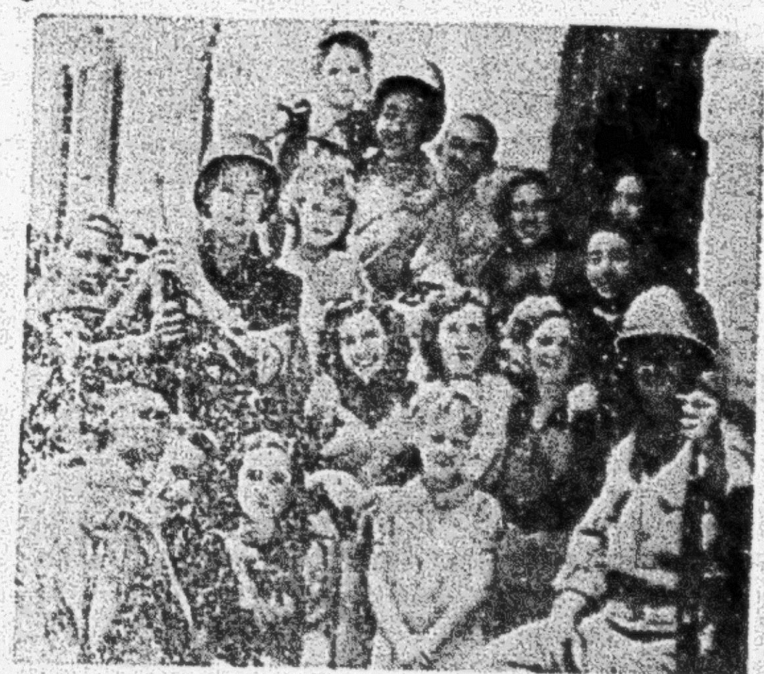
Los habitantes de Sicilia, hombres, mujeres y niños, acogen con muestras de viva satisfacción la llegada de las tropas norteamericanas que les liberarán de la dominación nazi. (Foto radiotransmitida de Argel a Washington.)