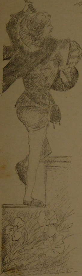
Un enemigo de Candil.

Rubio el cabello que se enmaraña sobre la tersa frente de nícar; negros los ojos de circasiana donde Cupido sus flechas guarda; flor las mejillas en que las nádas de roja aurora polvo derraman; boca chiquita ruido de gracias pomo de isencias; génesis de ansias; tornado el cuello como de garza, yirai no el serio, falte de palma y el pié chiquito como el de un hada; tai es la niña gentil y casta que en un humilde rancho de paja vi, ha pocos días toda entufada.