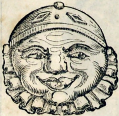
El Muñeco de Carton.

Que está lejos lo é Simon, Y quiero llegar temprano Pá mudar el redomón. Otro dia platicaremos Que no ha é faltar ocasión.