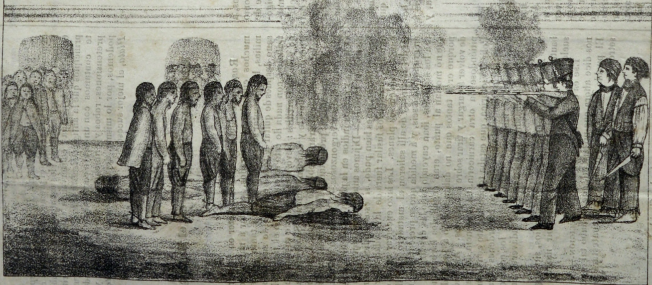
Indio de Caribon