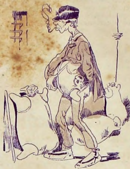
2—El Veigas se dedicaba á la introducción de vinos.