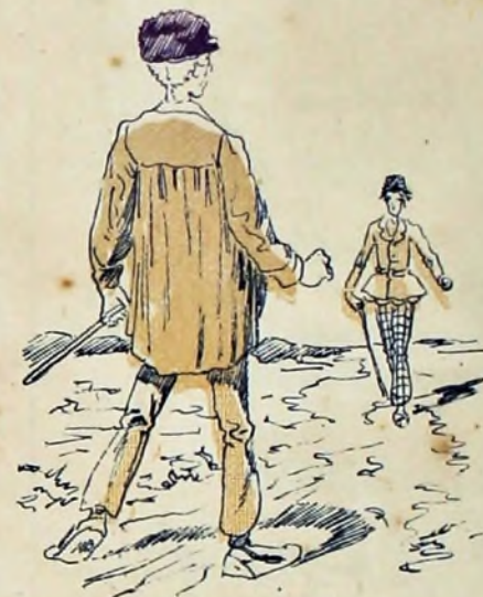
6—Y, claro; aquel odio mortal tenía que acabar de alguna manera; un día se encontraron frente á frente...