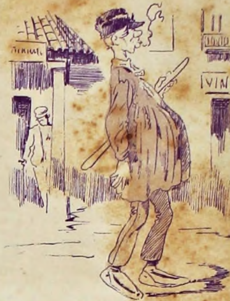
3—Como lo ve el curioso lector.