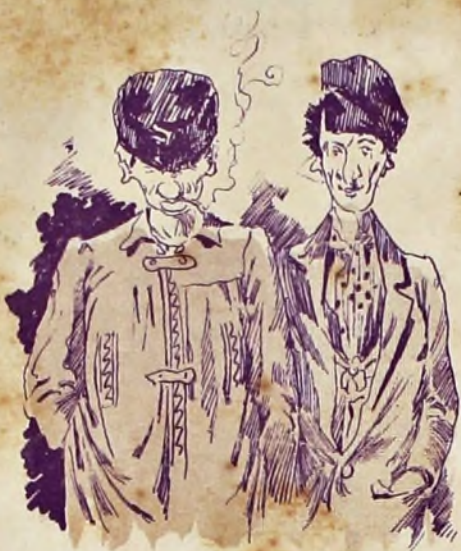
1—El Veigas y el Lata eran dos contrabandistas de los finos, pero que no podían verse ni en pintura.