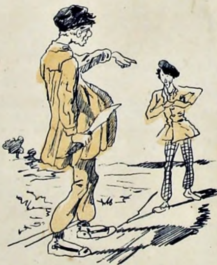
7—Y verse y prepararse para la lucha todo fué uno.