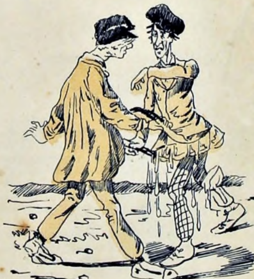
8—Y ¡zás! del primer envío el Veigas le echó al Lata todas las mantecas fuera.