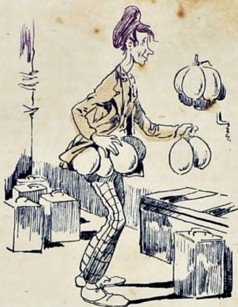
4—Y el Lata á la introducción de mantecas.