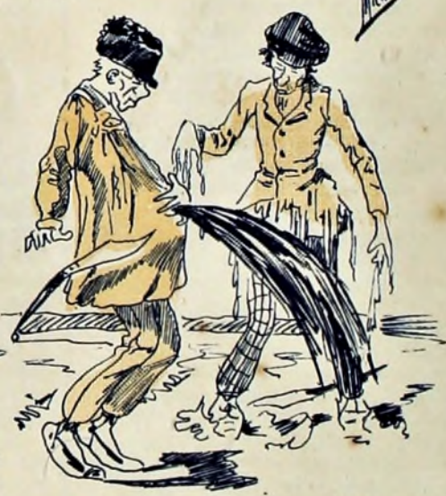
9—A pesar de lo cual el Lata, ¡pum!... ¿Pero ven ustedes como le abrió el pellejo de arriba abajo?