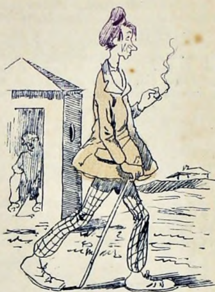
5—Como también puede verse por la muestra.