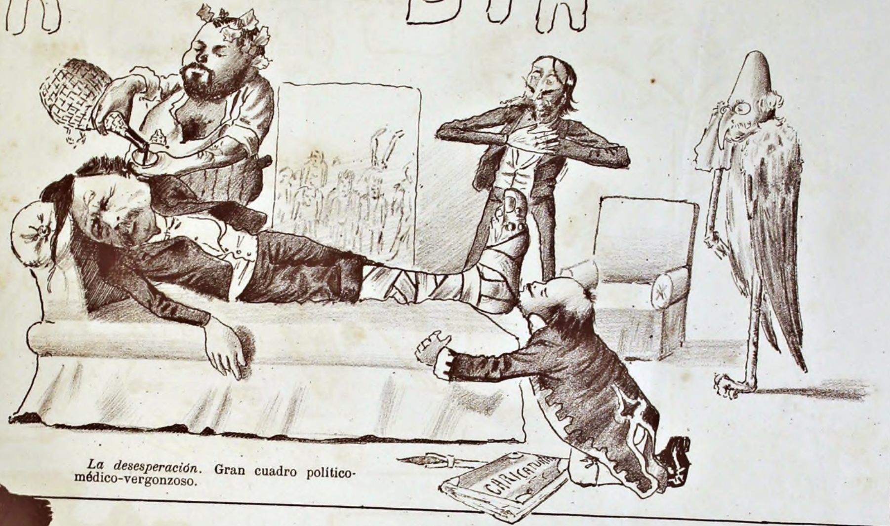
La desesperación. Gran cuadro político-médico-vergonzoso.