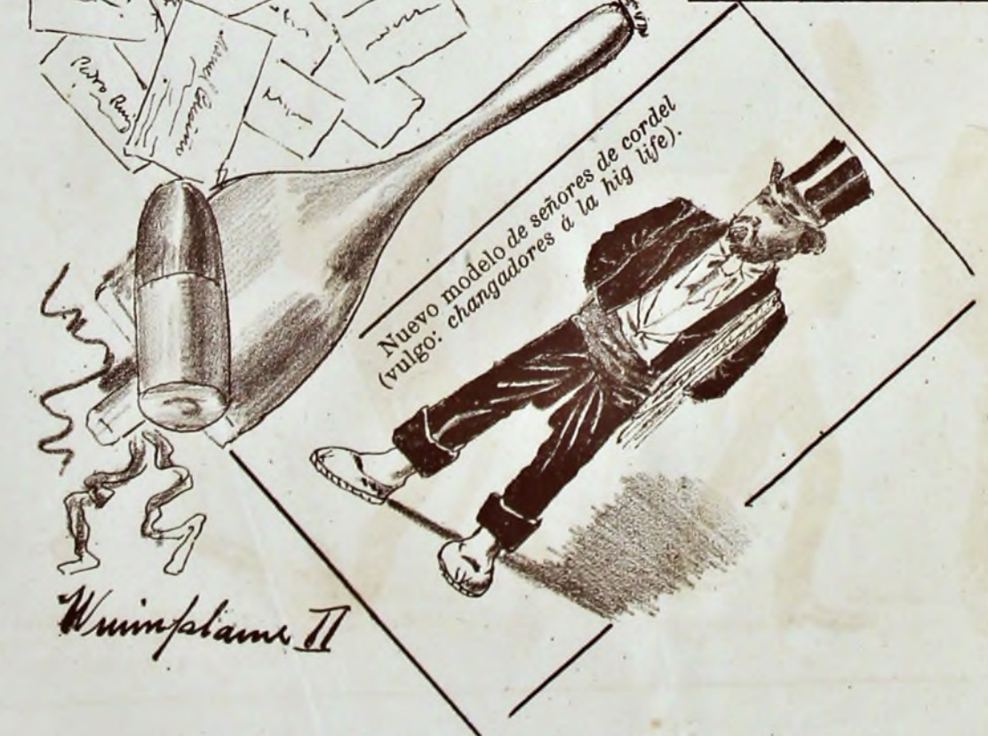
Nuevo modelo de señores de cordel (vulgo: changadores a la big life).