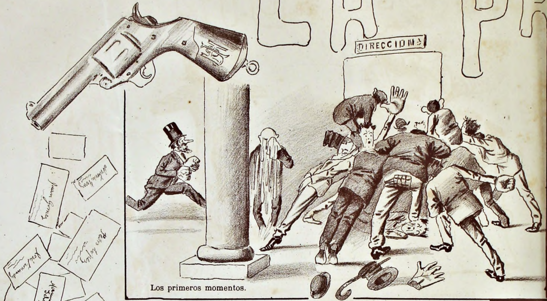
Los primeros momentos.