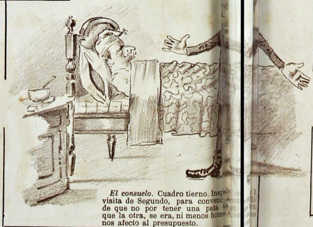
El consuelo. Cuadro tierno. Inspirado en la visita de Segundo, para convencer a los señores de que no por tener una pata que la otra, se era, ni menos hombre, ni menos afecto al presupuesto.