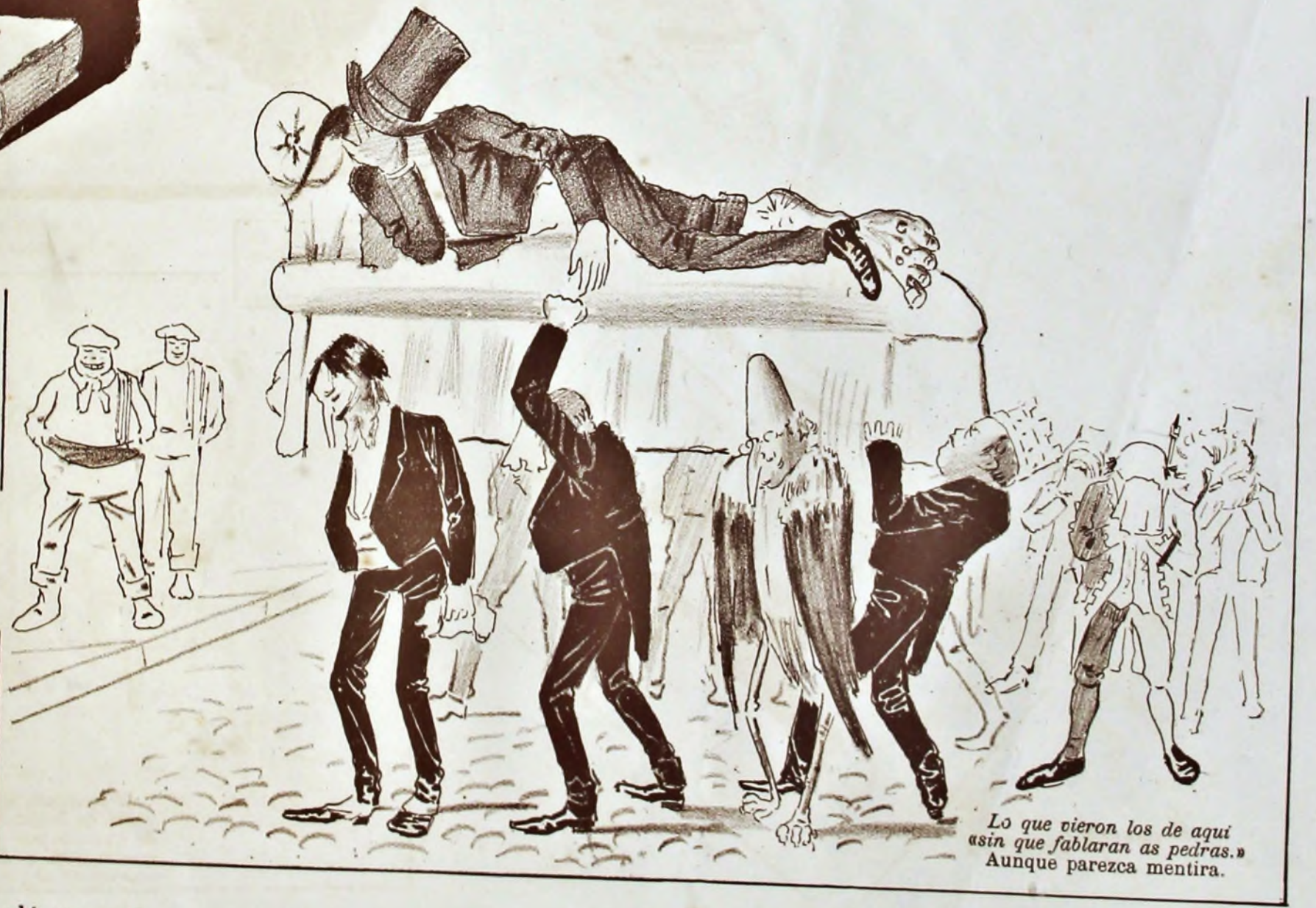
Lo que vieron los de aquí asin que fablaran as pedras. Aunque parezca mentira.

Lectores; he ahí una pata que no ha dado chica lata!