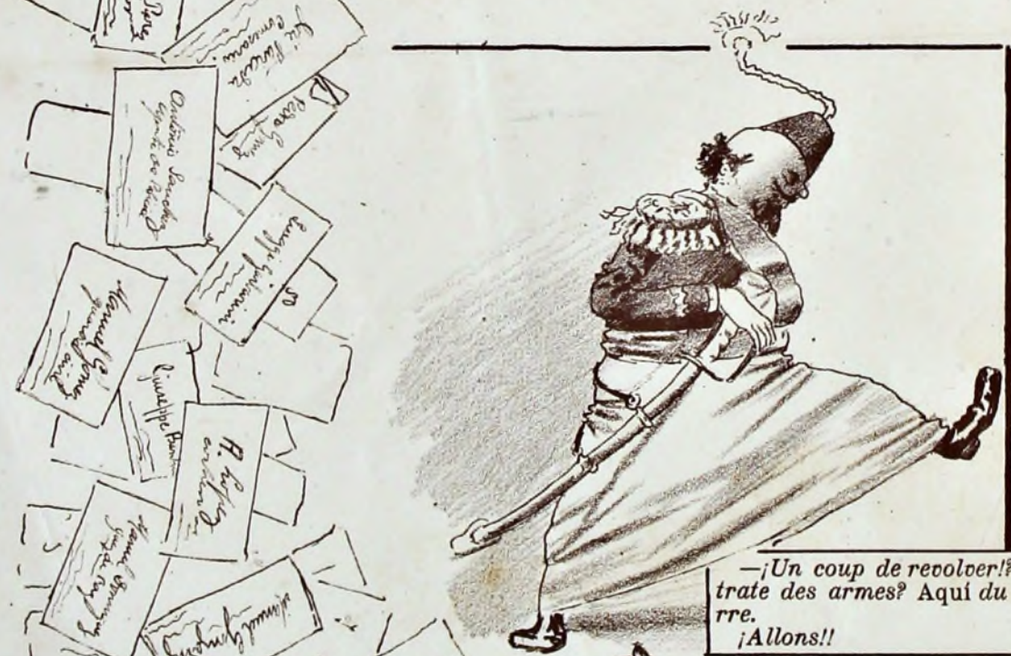
—Un coup de revolver! Oh mon Dieu! On traite des armes? Aquí du Ministre de la Guerre. ¡Allons!!