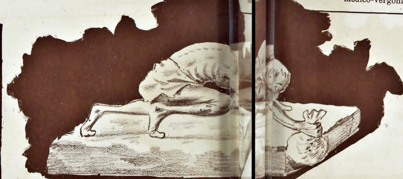
La adulación. Escultura para el Ministerio de la Guerra. Ojalá que se haga a los amigos dolientes. Ojalá que se haga a los amigos dolientes.