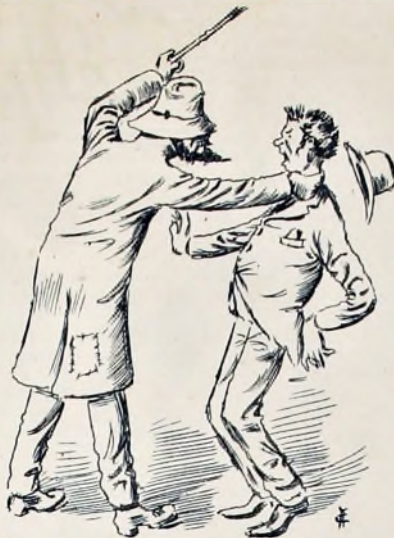
EL MAL LADRON