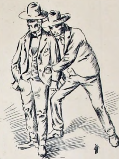
EL BUEN LADRÓN