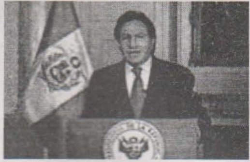
Toledo anunciando el Estado de Emergencia

Frente al capitalismo de hoy (y sus defensores) surgen movimientos que escapan a la lógica economicista-reformista anterior, aunando reclamos y prácticas que restituyen la política a la sociedad. Surgen así nuevas coordinaciones y organizaciones a nivel territorial para resistir. Es claro que dentro del capitalismo no hay soluciones. El caso argentino con su 19-20 de diciembre, con sus asambleas barriales y las ocupaciones-autogestiones es un buen precedente. En Perú están los indígenas y campesinos, que no tuvieron en Argentina un lugar destacado, muchos de ellos vinculados al cultivo de