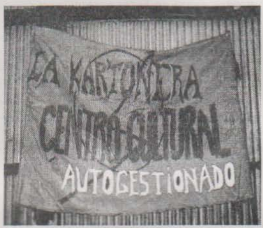
La Kartonera Centro Cultural Autogestionado

Según lo señalado por los mismos okupantes, se buscaba desarrollar a través de la misma distintos proyectos y actividades, como ser: talleres de música, artes plásticas, teatro, artesanías, reciclaje y medio ambiente, serigrafía, danza, huerta orgánica, medicina natural, cocina popular, etc. Así como también organizar eventos puntuales como