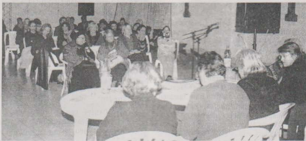
Foto de la actividad de presentación