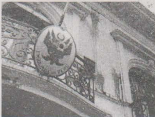
Frente de la embajada de Perú en Uruguay