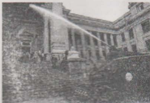
La represión durante el Estado de Emergencia

Hace mucho tiempo también que la capacidad de generar respuestas, de construir, ha sido enajenada por el Estado, o por lo menos eso ha intentado; el poder político pasó a ser el sujeto-objeto de las transformaciones, a quien reclamar o al que conquistar. A ello han ayudado los sindicatos que, manejados por burócratas aliados de los partidos políticos, en su estrategia electoralista eliminaron la autonomía de clase de los trabajadores y del pueblo, para hacerlos dependientes del Estado. Estados que, si en algún