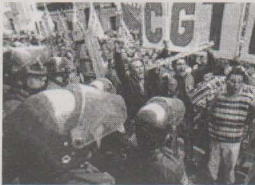
Marcha contra el estado de emergencia

Quiero terminar con otra frase de Camus: aunque profundamente decididos a colaborar en la instalación de un orden justo, sépase también que estamos decididos a [...] declarar que preferiremos eternamente el desorden a la injusticia.