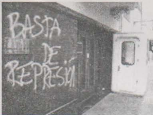
graffitti en la pared de la embajada, junto a la garita del policía