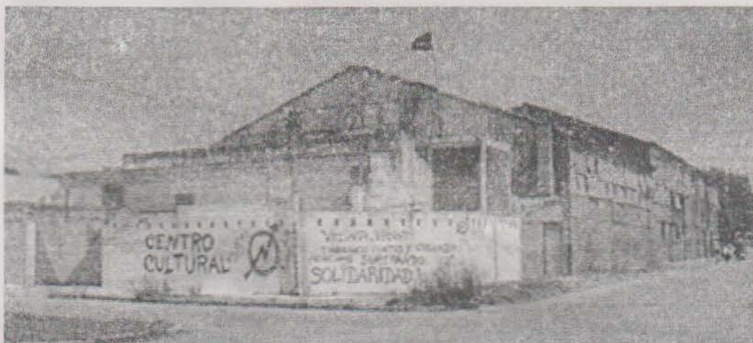
Esquina de la Kartonera

Ahora, queremos cerrar esta nota citando