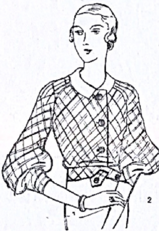
2. Con el talleur de la mañana quedará muy bien esta blusita. Las mangas tres cuartos, forma ranglan, con algunas alforcitas en los hombros.