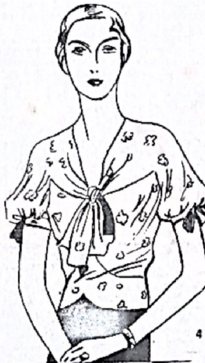
4. Blusa en crepe de Chine blanco, con motivos rojos y negros. La corbata y los moñitos de las mangas deben forrarse en crepé de Chine rojo.