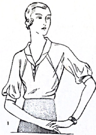
1. Este modelo puede hacerse en tela de seda blanca y rosa. Las mangas tres cuartos terminan en un puñito ajustado.