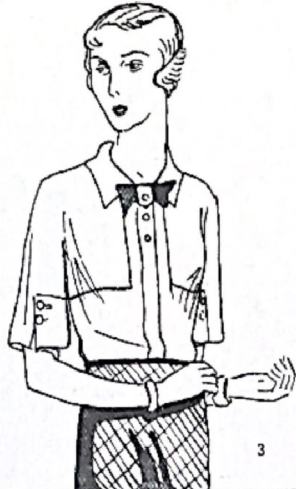
3. Modelo en tela de seda blanca o rosa, con corbatita negra.