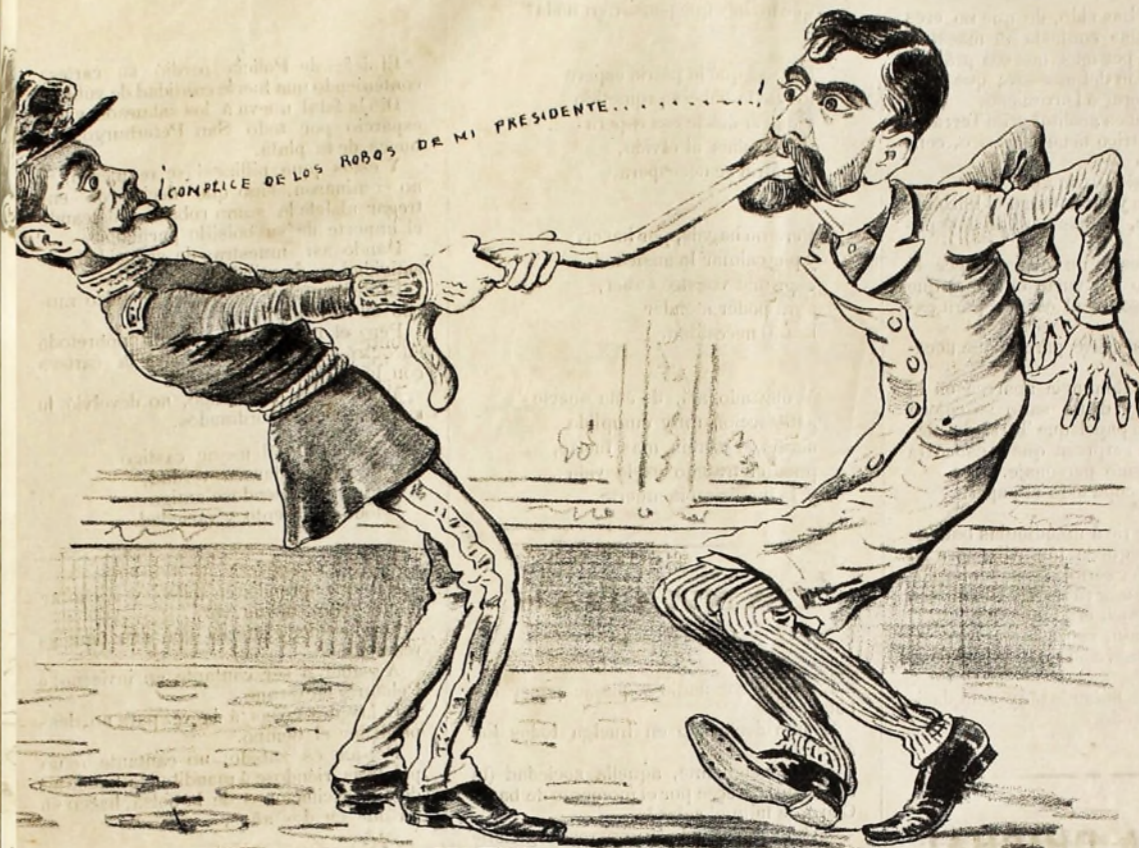
Insolente! Trompetilla! Murmurador! Deslenguado! Quien le manda consentir - Que desuelen a su amo?