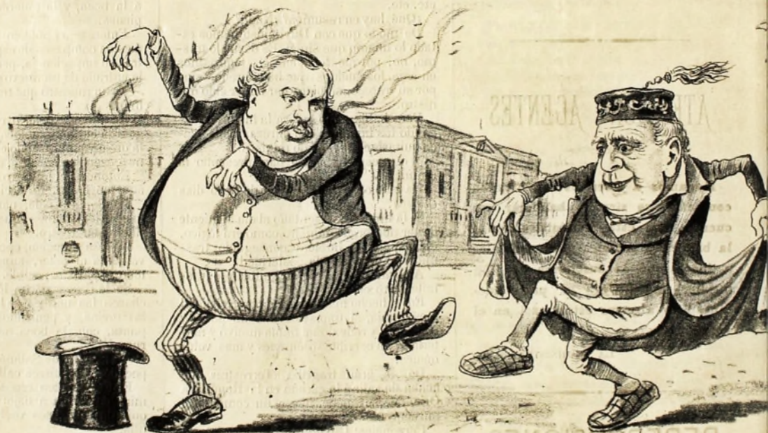
Bailan por que se incendió.