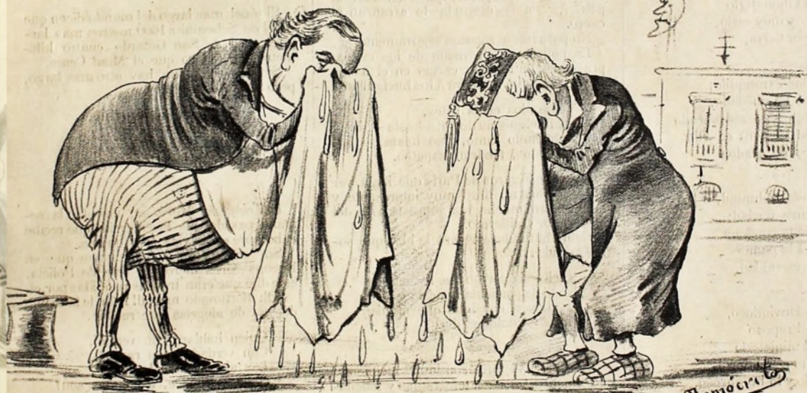
Lloran por que se apagó.