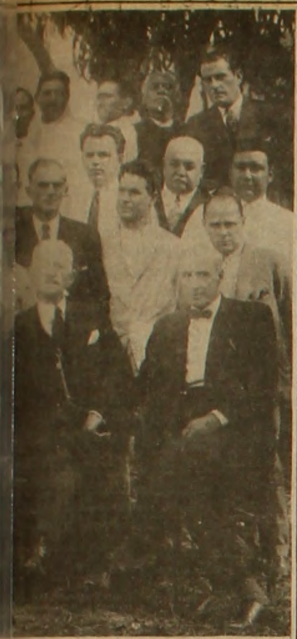
cional, junto al Gral. Juan 4.

menos que inmortal. El mismo error por cierto en el que incurrieron los tecnócratas, que siempre se equivocan, del 30. Ya producida la caída —recuérdese a Irving Fischer, recuérdese a Harvard— seguían anunciando que la prosperidad continuaba y continuaría.