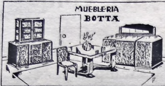
Elegante comedor lustrado en distintos tonos