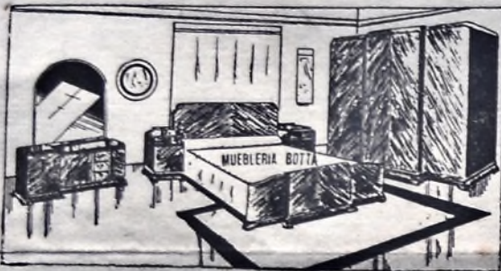
Sorberbio dormitorio abedul macizo, creación de nuestros talleres

Para reparaciones de radio contamos con un personal de técnicos