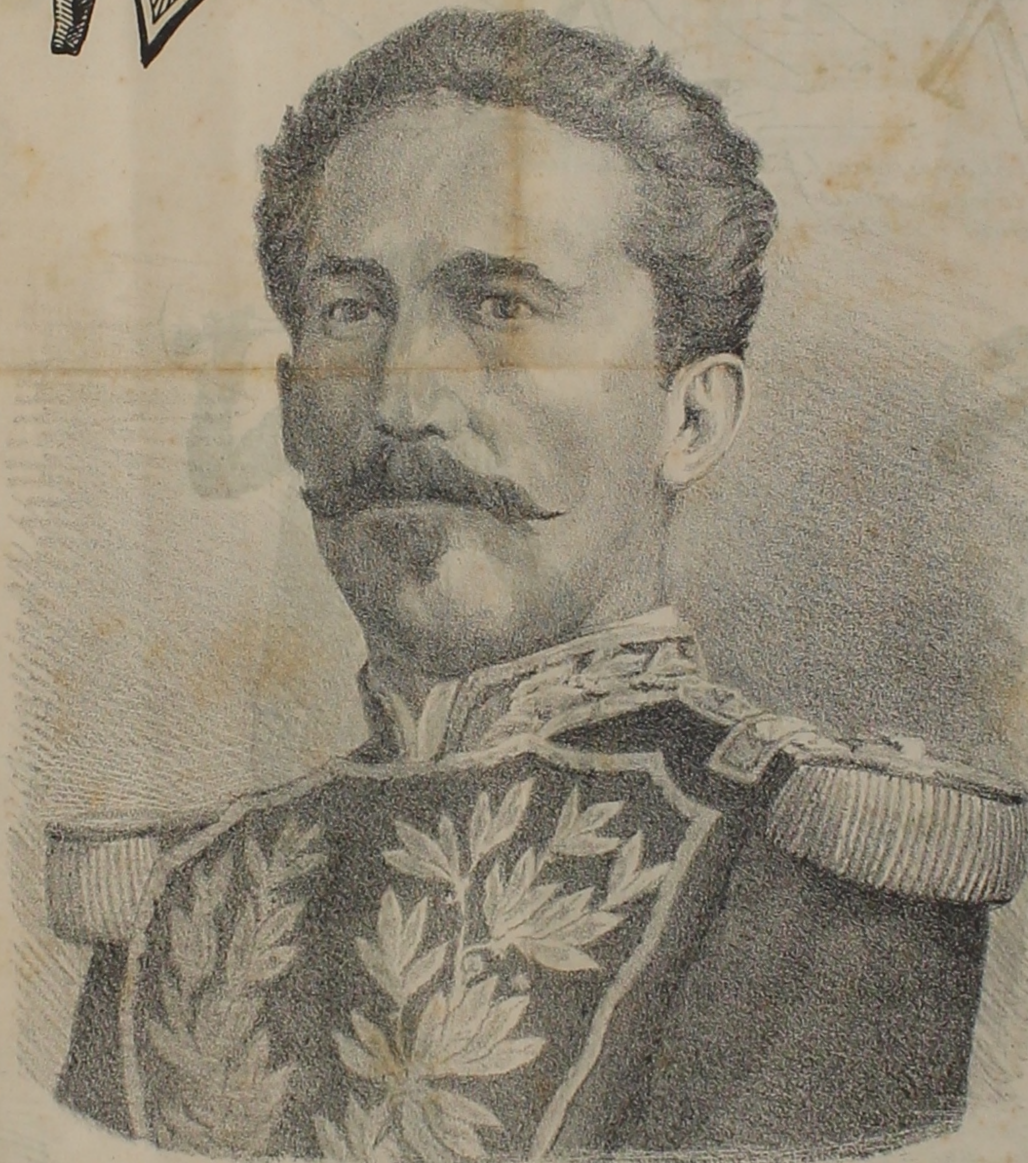
EXC mo SR. MINISTRO DE GUERRA Y MARINA GENERAL DON MAXIMO TAJES

Entro ahora en materia. Un bromista, medio muchacho, medio hombre, ni alto, ni bajo, ni barbudo, ni lampiño, alegre como unas castañuelas, juguetón como un mono y vivaracho como una ardilla, se entretenía en la mañana antedicha en el siguiente soliloquio: