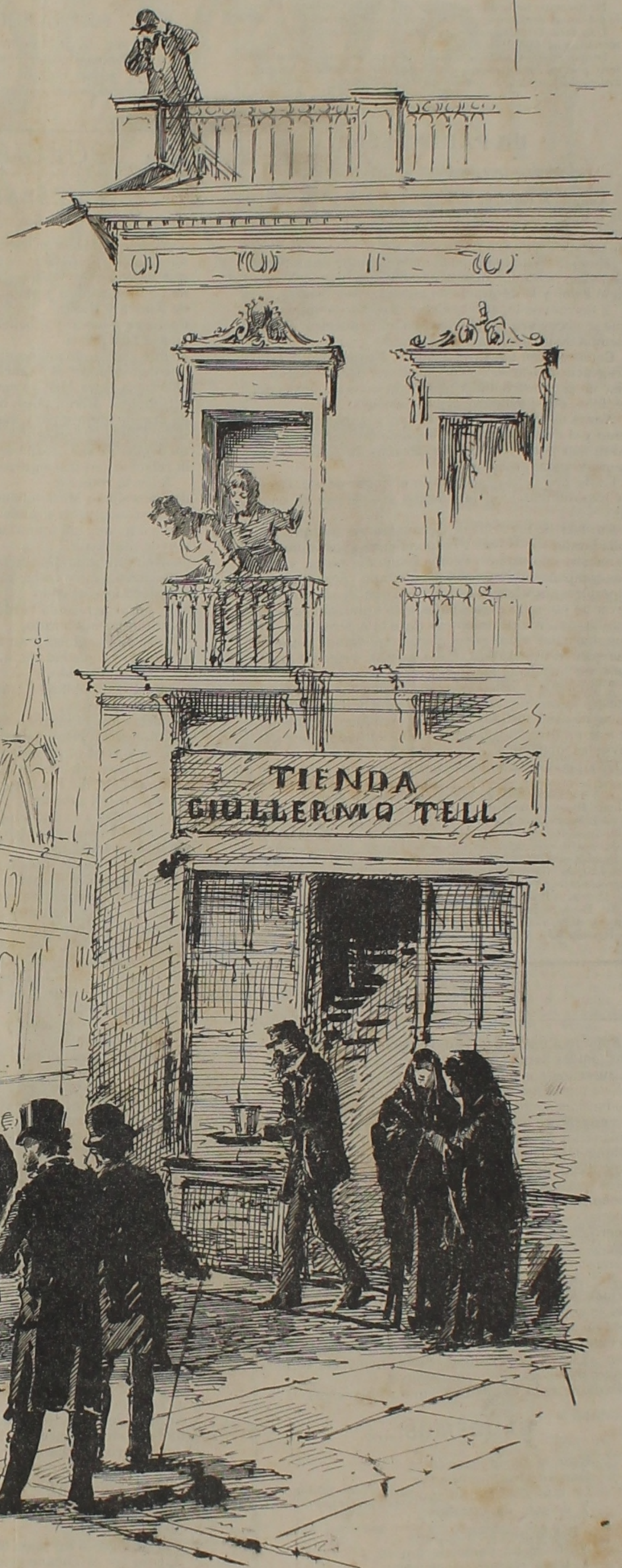
El lugar de la catástrofe y altura desde la cual cayó Novas

transporte a la botica donde se hecha la primera cura.