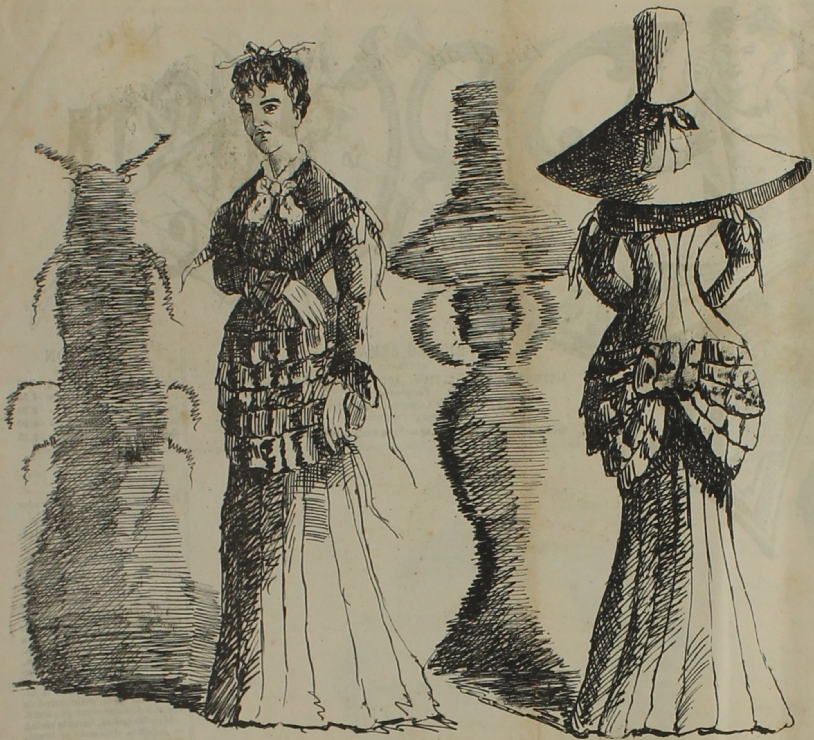
Las sombras de la elegancia