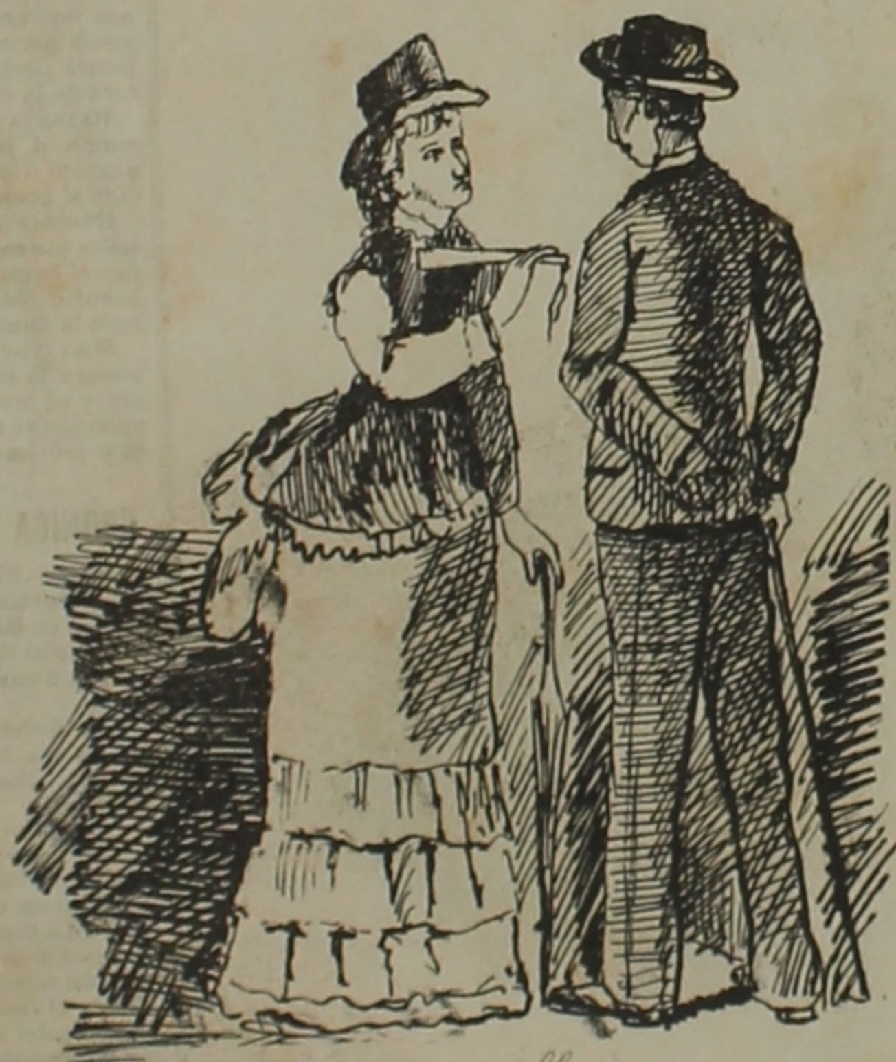
Una escena callejera.

ELLA: Como se entiende eso Caballero? ayer le oí a Ud., con una, hoy con otra. Cuántos somos y que es lo que U. piensa. El: ¿ Eso os causa estranjería? Pues sabed que lo hago así solo por salvar las apariencias y que los estraneros no sepan que yo os amo!