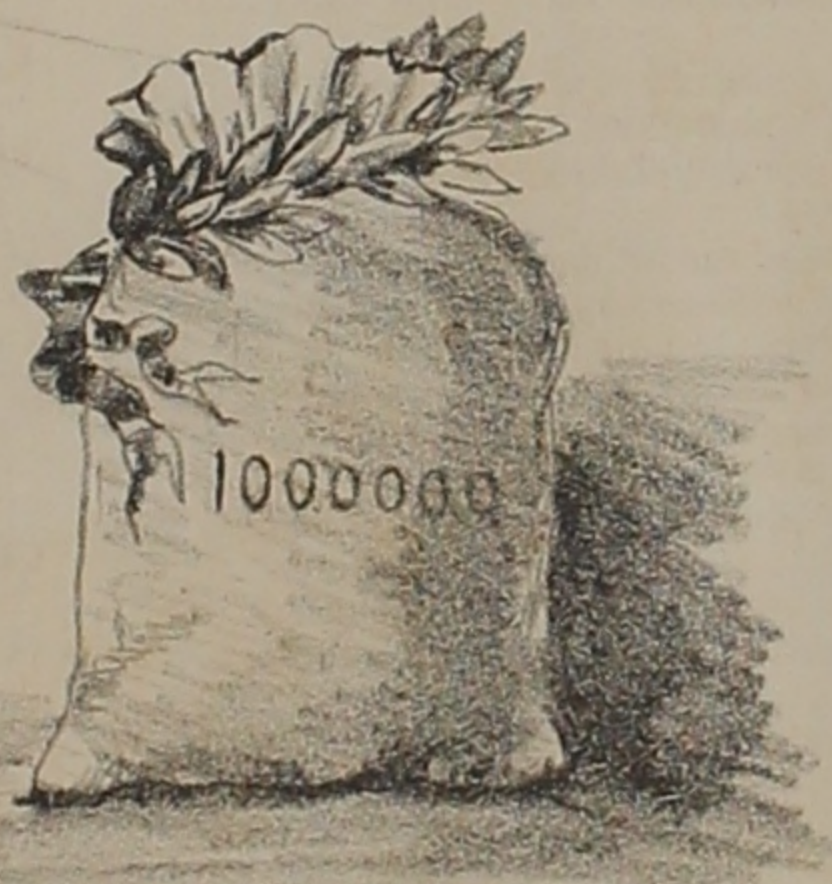
Lo que me falta para ser completamente feliz —