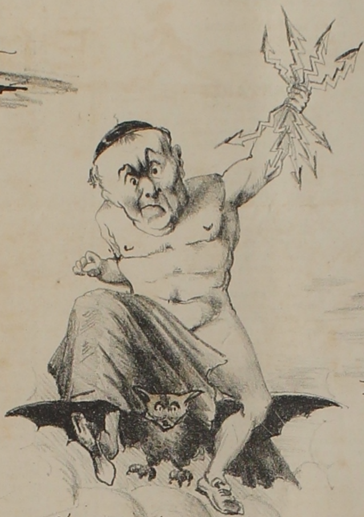
Doña Pascualona por la regiones etéreas