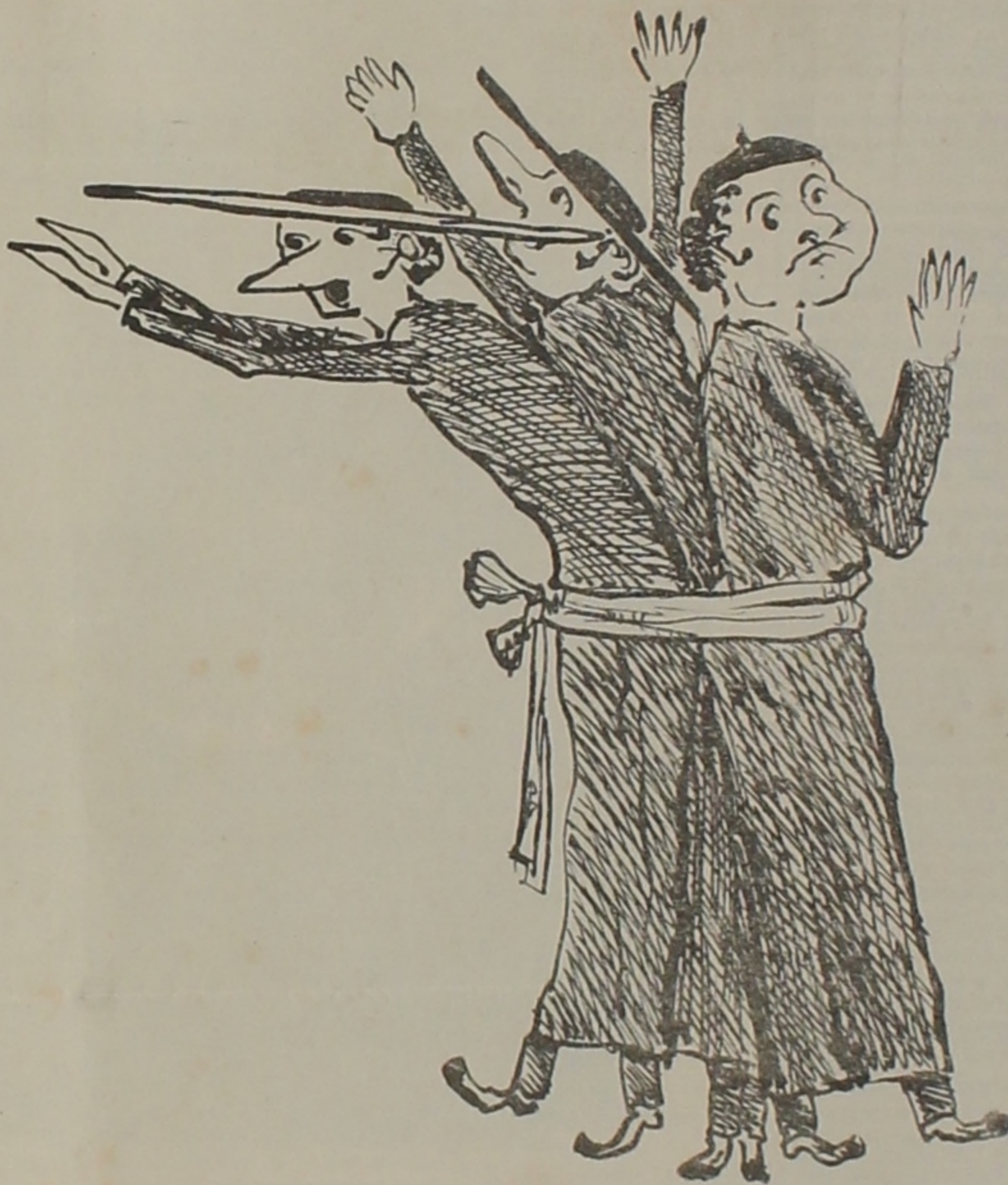
UN MANOJO DE GENTE INUTIL