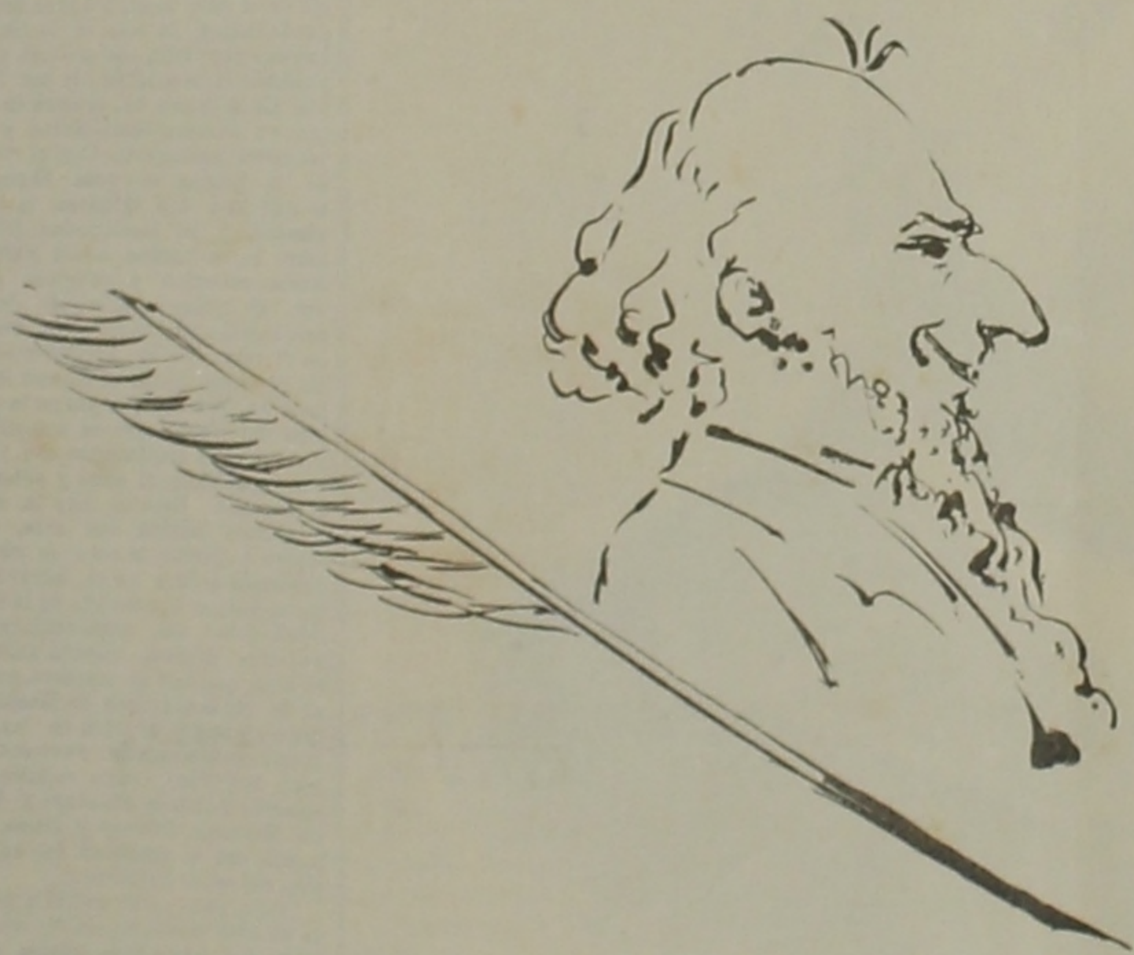
EL DE SIEMPRE....