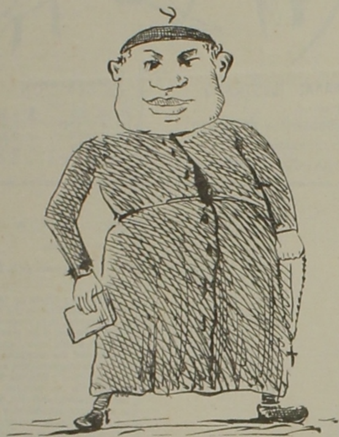
- HOY - Después de ser fraile