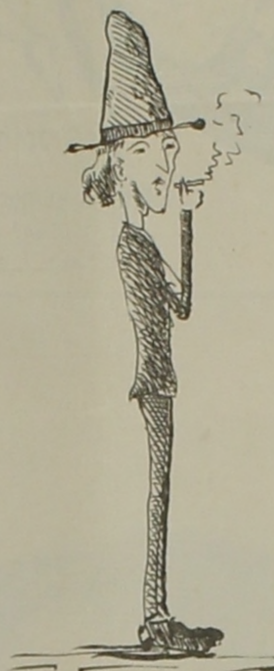
- AYER - Antes de ser fraile