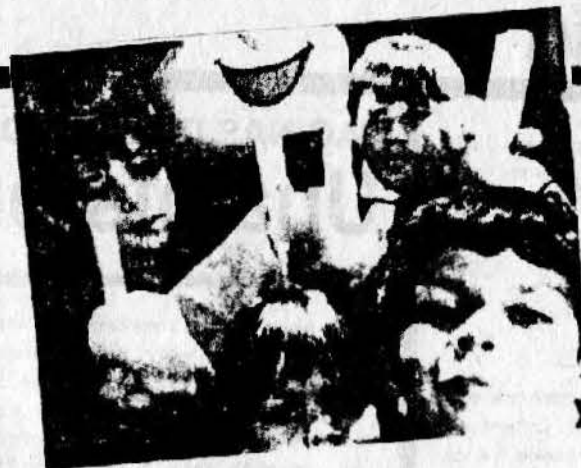
La Caja de Pandora: Asumir ser niños y niñas

Para publicar comunicados y saludos en esta sección, los mismos deben hacerse llegar a cualquiera de las direcciones de EL CANARIO hasta una semana antes de la fecha de publicación.