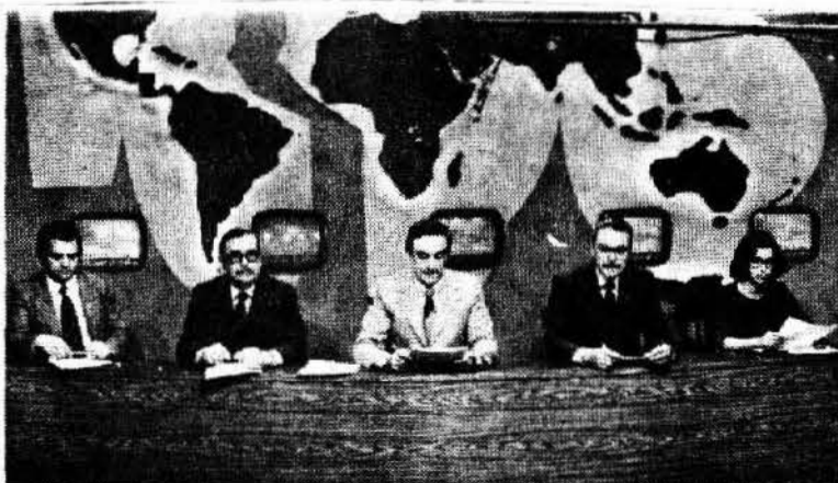
... con la televisión "cuadrada" de la época de la dictadura.