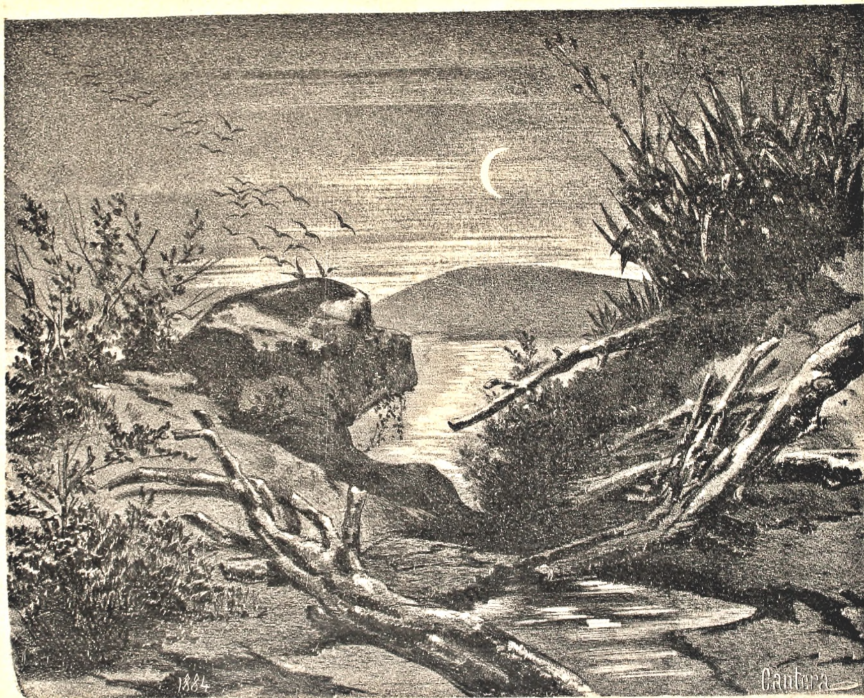
Entrada de una noche de Invierno