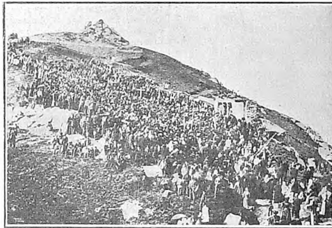
PONTEVEDRA.—La Guardia (Monte de Santa Tecla)

Quede, pues, pendiente esta deuda para otra ocasión, y esperemos a que hablen los que tienen ahora en sus manos la cinta con la que ha de hacerse y apretarse este lazo fraternal.