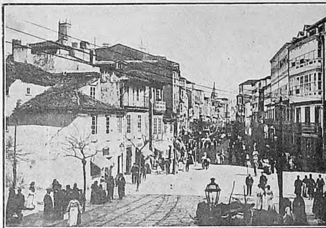
LA CORUÑA. — Calle de San Andrés

Soy panamericanista, si este tér- mino supone la unión íntima y una solidaridad verdadera de las nacio- nes del continente. Creo que sin re- celos, sin prejuicios y sin hacer caso a los atavismos históricos que pudieran hablarnos de odio, de separación, de conquistas, deben las naciones del Continente formar un todo compacto que sirva para fijar conductas colectivas, acciones de