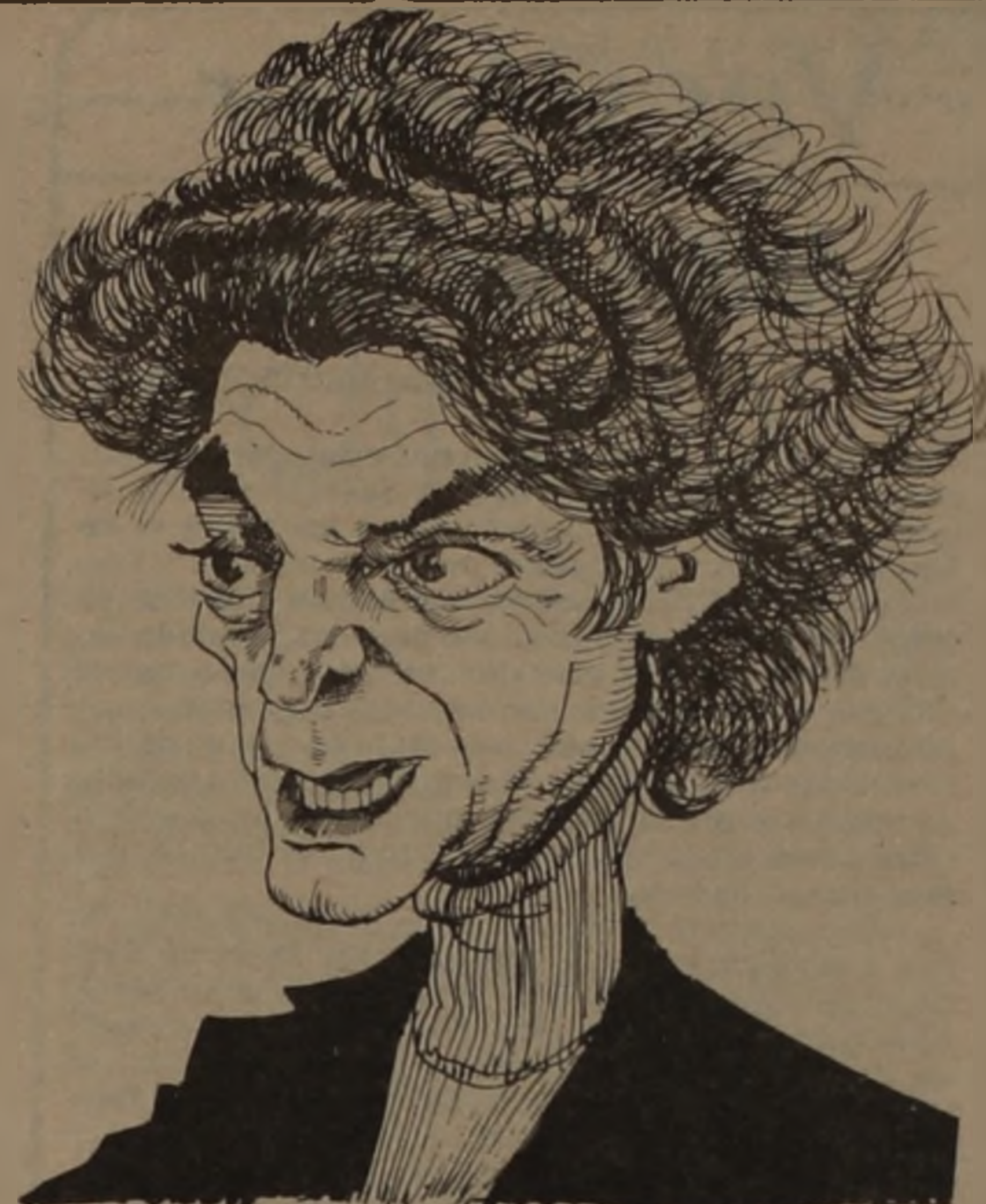
Alfredo Alcón estará presente en la muestra con la Comedia Nacional Argentina