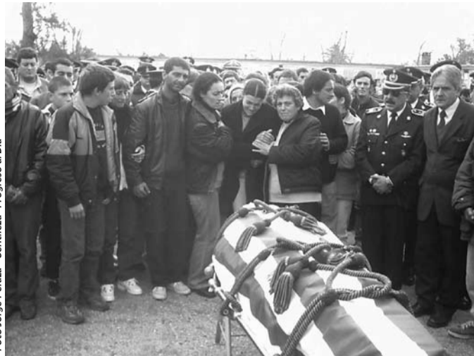
Momentos de dolor durante el sepelio del agente Cordobés en el Cementerio de Canelones.

do los detalles conjuntamente con la Policía de Montevideo. "Por supuesto que de todos modos tenemos que estar atentos a ese tipo de hechos". Sin 222 en centros de enseñanza Frente a que las carencias económicas han provocado que algunos centros de enseñanza no cuenten con servicio 222, el Jefe de Policía, Pereyra Roldán respondió no tener conocimiento "de que haya instituciones de enseñanza que hayan prescindido del servicio 222, sí en otros servicios como la Intendencia Municipal. Pero que haya un policía cumpliendo un servicio extra, no significa que se deje de lado la atención debida de cada ciudad. Por ejemplo en este momento estamos trabajando con mayor énfasis en uno de los liceos de la ciudad de Pando".