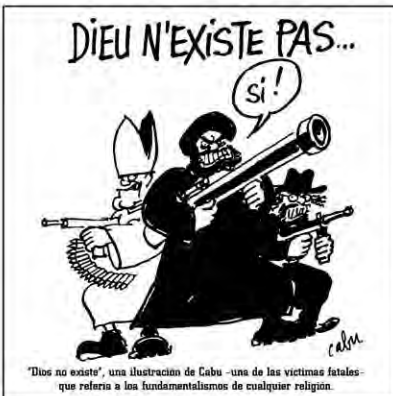
"Dios no existe", una ilustración de Cabu -una de las víctimas fatales- que refería a los fundamentalismos de cualquier religión.