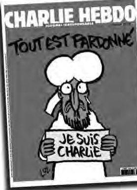
por Zineb El Rhazoui, reproducido de "Le Monde"

Así es en Charlie, algunos vienen del aluminio, otros son ferroviarios, intensivistas, juristas, psicólogos, economistas... Pero todos