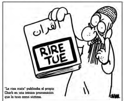
"La risa mata" publicaba el propio Charb en una irónica pronunciación que lo tuvo como víctima.