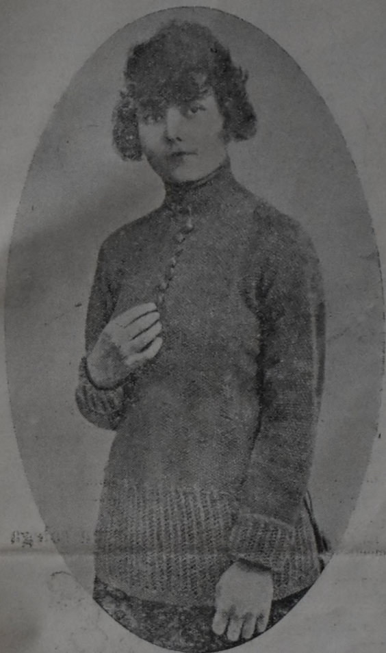
Li ndo sweater de lana en punto jersey con faldeta y boca-manga caladas. Queda muy bonito en colores, blanco, beige y camello.