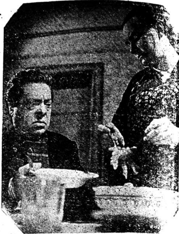
Un pasaje de la extraordinaria película «Emigrante»