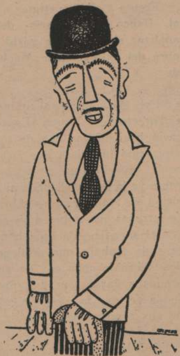
Mister ANTONY EDEN, el clarividente de la política europea, que precisó desde el primer momento cuál debía ser la posición a adoptarse por Gran Bretaña.

de defensa que pueden hacer peligroso cualquier ataque contra este país. En cuanto a los aparatos aéreos actualmente en servicio, son por cierto los mejores que se hayan construido en el mundo. Manifestó también que una muestra de los esfuerzos realizados para lograr esos frutos, residía en el hecho de que se vienen gastando dos millones de libras por semana solo para la aviación.