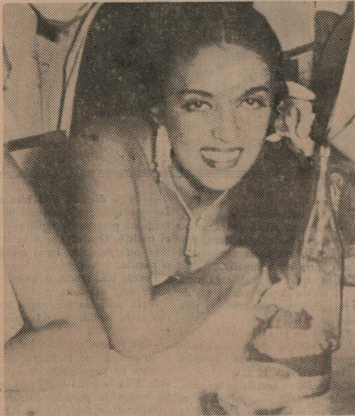
KATY JURADO, estrella del cine mexicano, que actuó también en Estados Unidos en varios films.