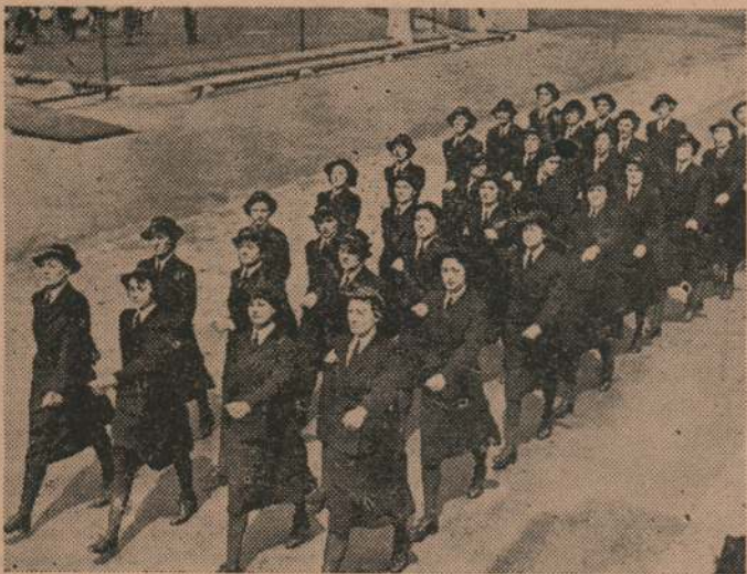
Mujeres inglesas que prestan servicios activos en la guerra.