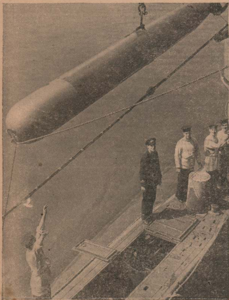
Ubicando un torpedo de un sumergible británico.