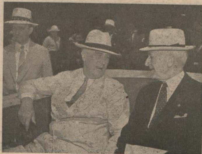
El Presidente de los EE. UU. de Norte América Franklin D. Roosevelt y su secretario de Estado, Cordell Hull

¿Y dicen los Herreristas que por aquí no pasó nada?