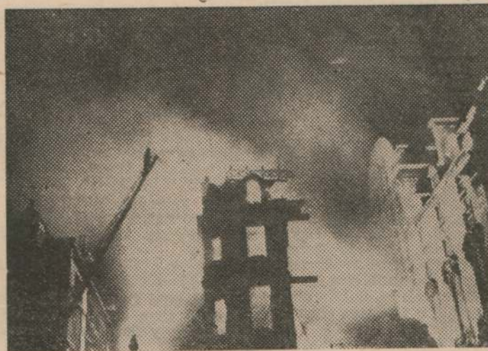
Muerte, fuego, ruinas. La siembra de la bestia parda

Auncie en "DEFENSA NACIONAL" Su elevado tiraje, garantiza su eficacia