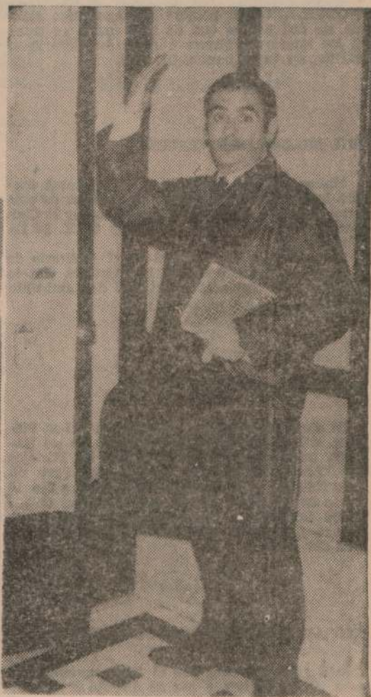
¿Para triunfar, el actor uruguayo debe irse o quedarse?