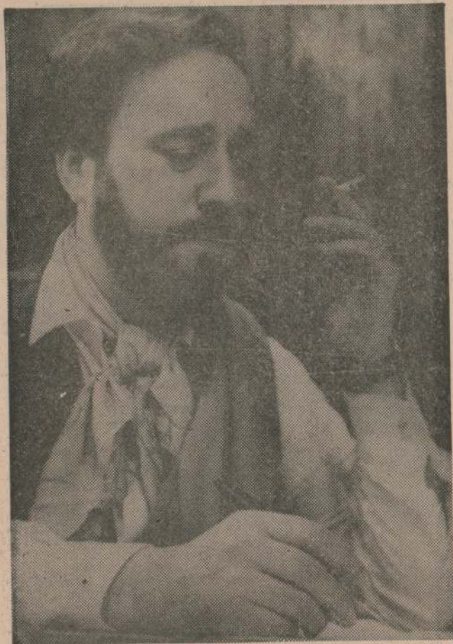
Anselmo Grau vuelve a la pantalla chica