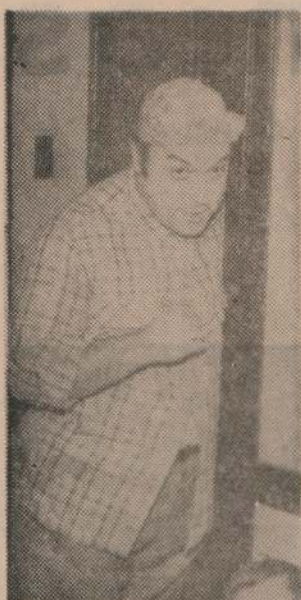
¿Aceptaría roles de "garán recio"