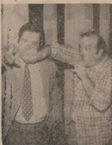
...¿Y si hablamos de censura?