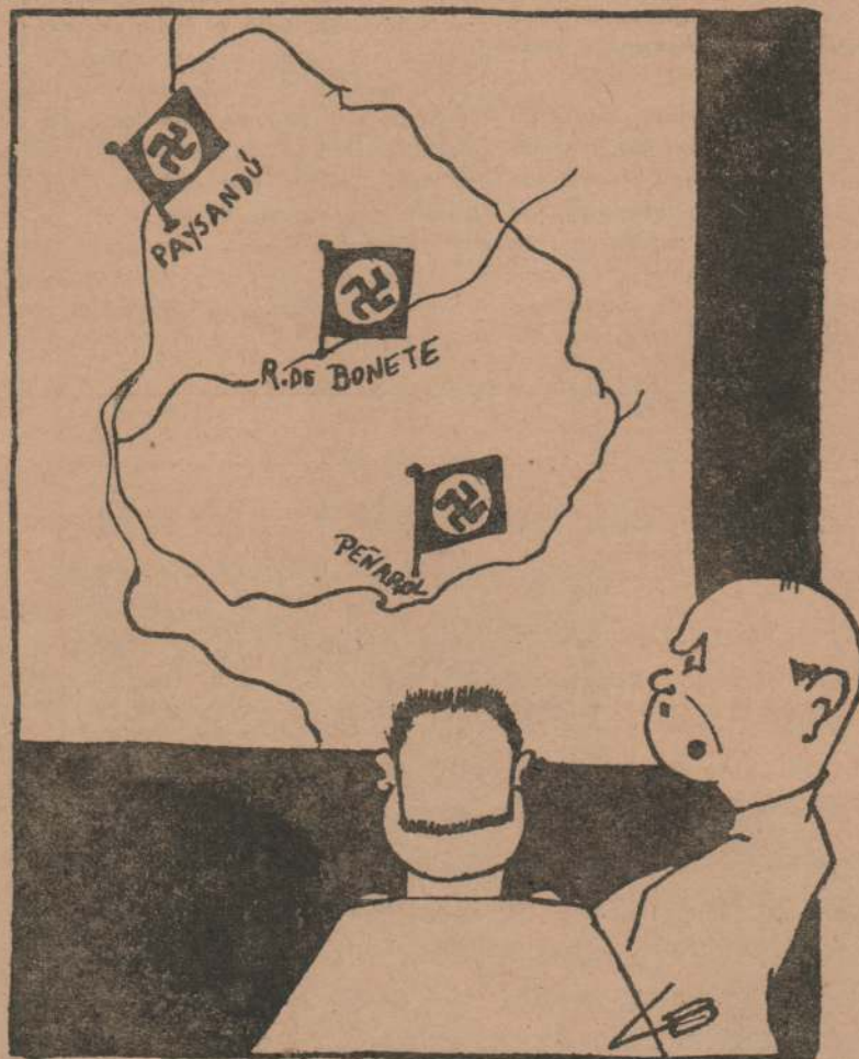
TRES PUNTOS DE APOYO

("Diario Israelita", Buenos Aires 8-VII-38).