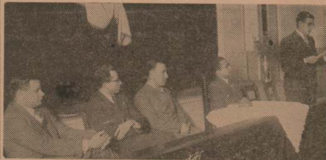
Aspecto parcial que ofrecía el salón al iniciarse el acto. A la izquierda: la mesa directiva integrada por destacados dirigentes de la Juventud Evangélica