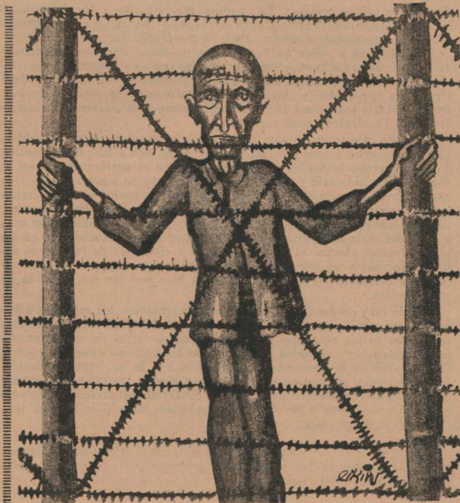
Símbolo de la "Gran Alemania"