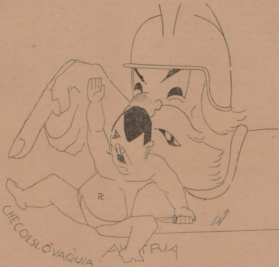
MARTE A HITLER: Vamos hijo mío, da tu segundo paso sin miedo.