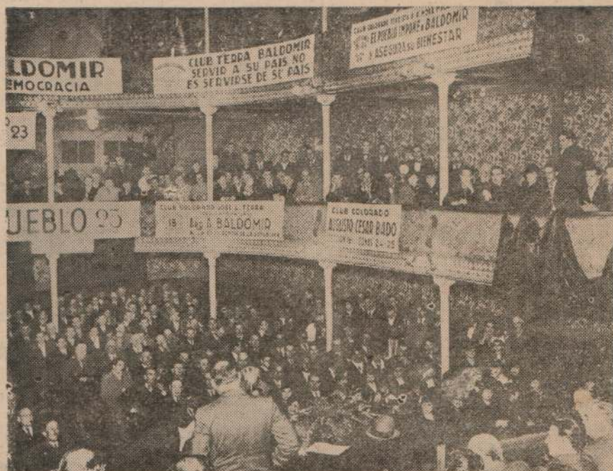
DE LA ASAMBLEA REALIZADA EL DIA 4 DEL CORRIENTE EN EL CINE TEATRO "STELLA D'ITALIA"

Reafirmación de fé, en el triunfo de la democracia