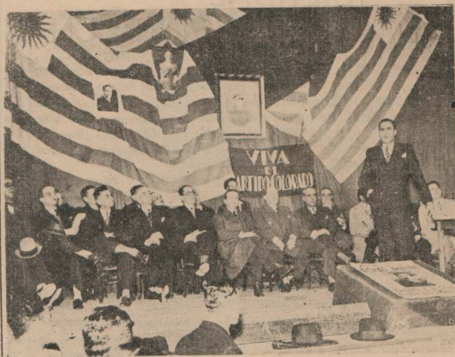
Rodeado de personalidades de la Ciudad de Durazno