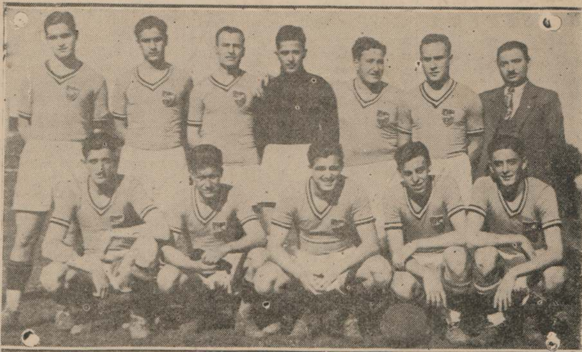
EL CABALLERESCO TEAM DE "SAN MIGUEL"

Es de destacar el hermoso y simpático gesto tenido por los clubs Sportivo Cerrito, Huracán, J. Agrícola y Rosarino Central, al donar a su Liga una copa adquirida en la vecina orilla, que