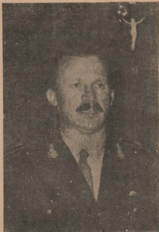
ONGANÍA: estará presente