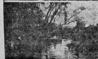
Otro paisaje poético del Caupirú.