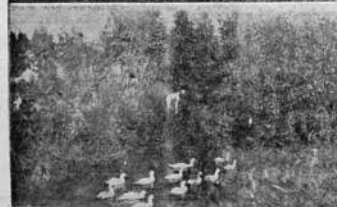
Paisaje del Caupirú.