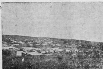
Vista general del departamento de Rivera.