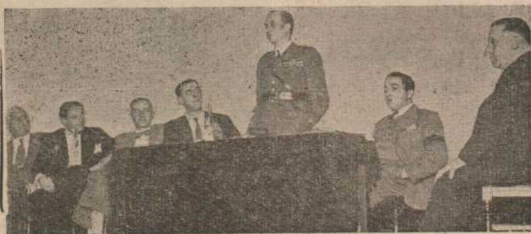
Tte. Cnel. Héctor J. Blanco, Director Dptal. de Defensa Pasiva, haciendo uso de la palabra en una de las reuniones realizadas por la 4.a Sección en el Centro Gallego

Prosiguiendo en nuestra labor de hacer conocer en todo el territorio nacional, la forma en que se van desarrollando las actividades de la Defensa pasiva, hablamos en estas líneas de las reuniones que a tal efecto se llevan a cabo en las distintas secciones de la capital.