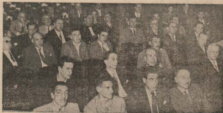
Parte de la concurrencia que asistió al acto en la reunión del Centro Gallego, — (Reunión de Jefes de Barrio y de Manzana)