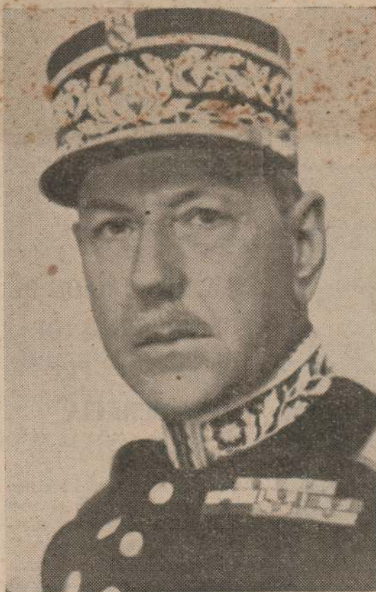
General de División Arquitecto Don Alfredo R. Campos, verdadero gestor y propulsor de la Ley de la Defensa Pasiva. — Como Ministro de Defensa Nacional, no escatimará esfuerzos para llevar al país a una capacitación defensiva a tono con las obligaciones internacionales suscritas

Por lo tanto, rogamos encarecidamente quiera comunicarse a esta Dirección, la falta de cumplimiento de lo arriba mencionado, como así también, si se presentara alguna persona sin la autorización correspondiente que lo acredite, como que forma parte de nuestro personal.