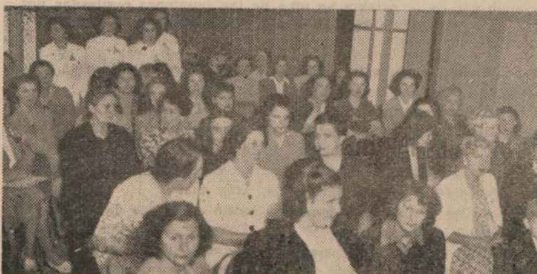
Grupo de componentes de la Comisión Vecinal de Protección a la Población Civil de Punta Carretas, que asistieron al acto realizado en la Escuela Francia