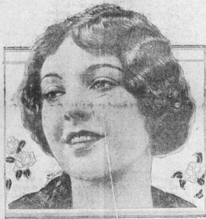
LILA LEE starring in Paramount Pictures