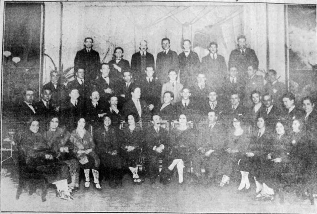
EL CUADRO ARTISTICO "CASA GALICIA", CUYA BRILLANTE ACTUACION CONSAGRA SU MERECIDO NOMBRE

En su afán por la cultura, sostiene un plantel escolar con clases nocturnas, que es un foro y guía para los estudiosos de todas edades; su biblioteca y sus mesas de lectura son una información para todos, encontrándose en ellas diarios y revistas de España, Madrid y otras partes, a la vez que los diarios locales, de Buenos Aires, etc. Celebra continuados actos co-