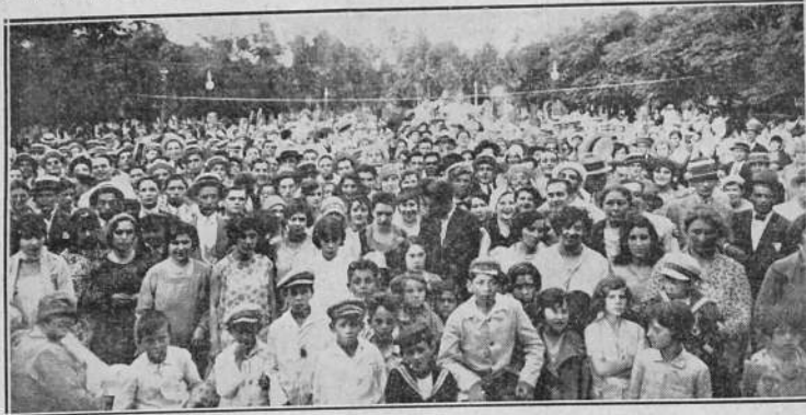
Numerosa concurrencia que asistió a una de las últimas romerías realizadas en el campo de fiestas de Quinta de Salud

Merece también un aplauso la Junta Directiva, quien se ha empeñado vivamente para que en nuestras fiestas, tanto en la Quinta de Salud, como en el salón de la Casa Social, no falte detalle de ninguna clase, por lo que enviamos tanto a la Comisión de Fiestas, como