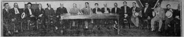
El nuevo Directorio de Casa de Galicia al tomar posesión de sus cargos en la Asambléa efectuada el 31 de Diciembre.

Esperamos ahora el cumplimiento de la labor que correspondió realizarse en el presente año, confiados, una vez más,