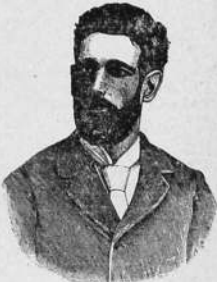
JOSE ALONSO TRELLES a los 30 años (debajo inédito)

No era criollo de nacimiento, José Alonso Trelles, pero sí, de sentimiento y de corazón. Tus cantos poéticos que sentías con tanta intensidad y dedicados con gran cariño hacia nuestras ancestrales costumbres, bien te dan el título de oriental ¡desecho viejo! Y... ya lo creo que eras criollo de alma y de vida, como la carqueja y los macachines de nuestras cuchillas. Si hasta vivías en un pueblo criollo por excelencia. En vos el criollismo, era más, mucho más que una cosa nueva, fresca y llena del coraje rudo y la hombría de nuestros buenos gauchos, verdaderos centauros de la Patria que Artigas creó y arrancó de las mistificaciones centralizadoras de los gobiernos del Plata, que se habían liberado del yugo extranjero; es todo un himno, forjado al