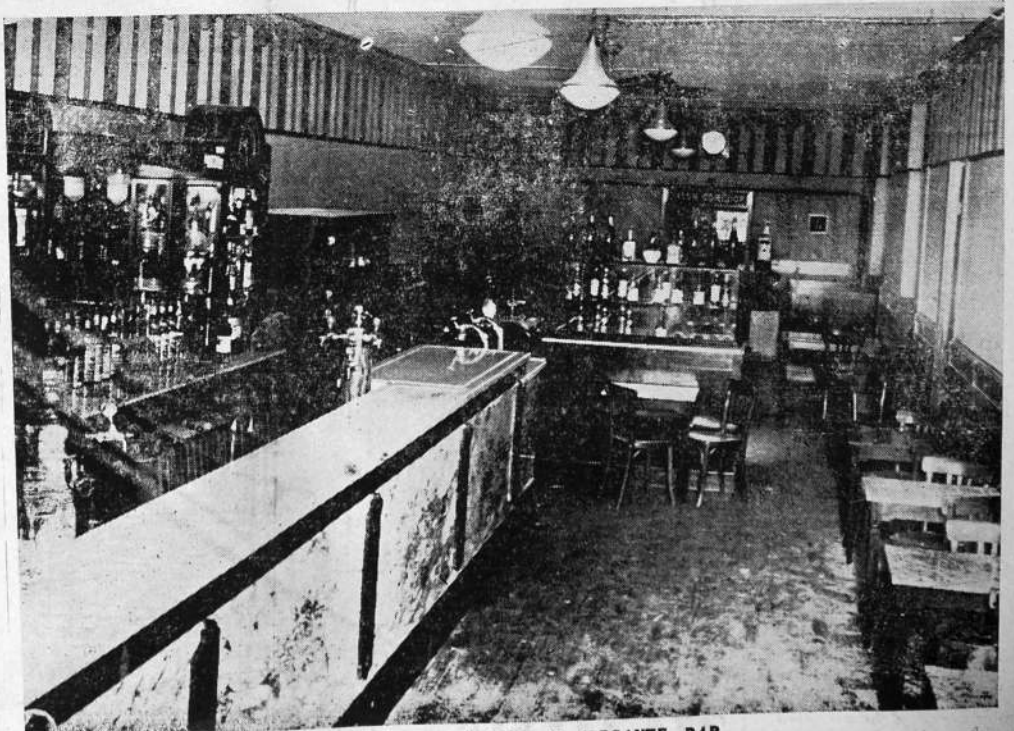
VISTA DEL NUEVO Y ELEGANTE BAR