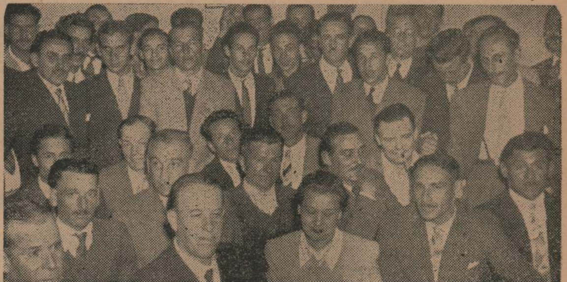
Vista parcial de los Delegados de distintos Sindicatos Autónomos y Democráticos, asistentes a la reunión en la cual se decidió la creación de la Confederación General del Trabajo.