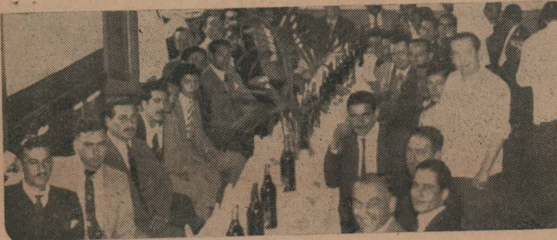
Como afirmación de Compañerismo y unidad gremial, que son las bases sobre los cuales se crea la Confederación General del Trabajo, se realizó un almuerzo en un restaurant céntrico, entre dirigentes de varios Sindicatos adheridos.