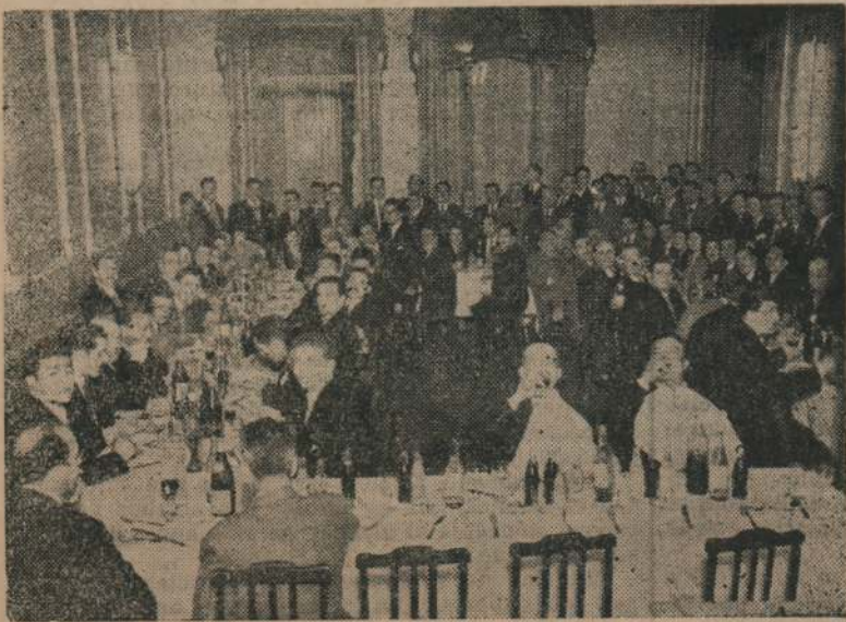
Vista parcial de la numerosa concurrencia

Esta Asamblea a la cual concurren gran cantidad de obreros navales, nos demuestra en los hechos que este importante gremio está comprometido de los postulados que defiende la Confederación General del Trabajo y sus Organizaciones adheridas, para bien y honra de los trabajadores uruguayos.