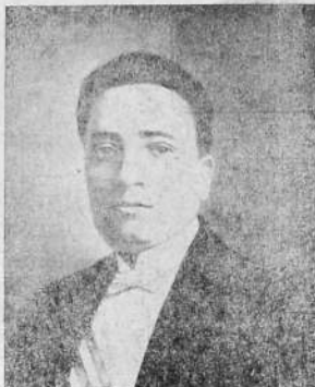
Dr. Baltasar Brum