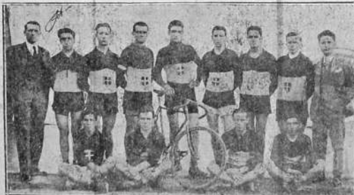
Con gusto engrandecemos nuestras columnas con la fotografía del fuerte cuadro ciclista del Anax Sportivo Italiano de Santiago. Entre ellos se ven algunos conocidos nuestros, y otros que sin haberlos visto por estas latitudes desiste infinidad de partidarios que siguen con performances a través de las informaciones del club.