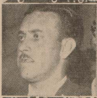
2do. Titular de la Lista 51