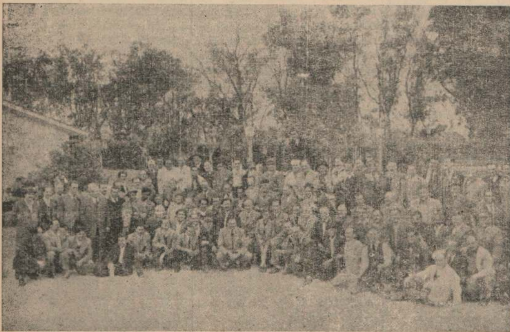
Esta foto fué tomada en la quinta perteneciente al Sindicato de Canillitas del Uruguay el último domingo de octubre de 1950, en ocasión de conmemorarse "El Día del Cartero".

¿Tendremos este año la satisfacción de festejar el nuevo aniversario en nuestro propio campo?. Sí, es la firme voz de una indomable voluntad.