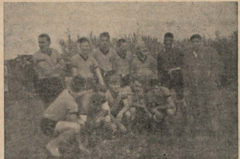
Uruguay Postal F. C. de destacada actuación en la Liga Independiente del Barrio Guruyú.