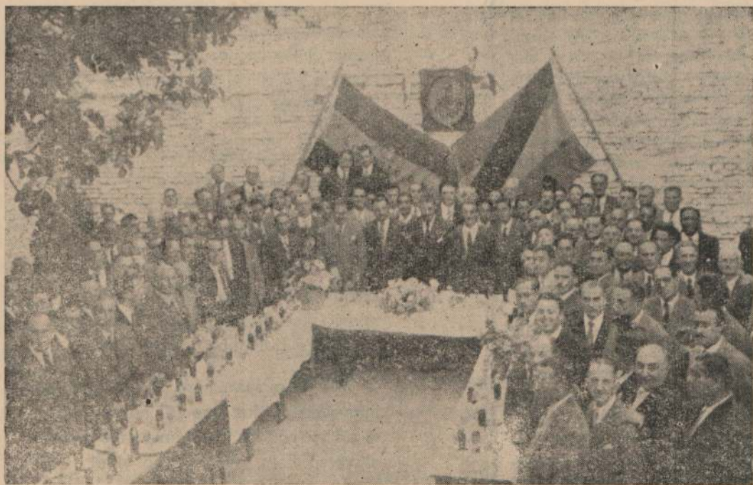
Con motivo de la sanción del presupuesto de la Dirección General de Correos, parte del personal se reunió en el cordial ágape que da cuenta la nota gráfica precedente.