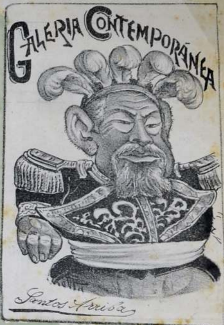
SAL LÁZARO DEL PANTEON, LEVÁNTATE BUEN ALCT DES Y VUÉLVETE A SER EL BAJIDES DE LA DICHO SA NACION.