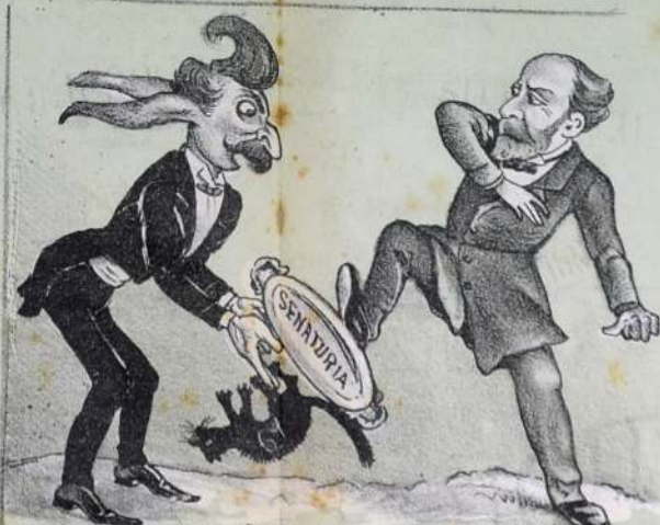
YO NO ACEPTO ESOS REGALOS. QUE SUELEN TRAER POR LO MENOS LA CONFUSION CON LOS MALOS I EL DESPRECIO DE LOS BUENOS