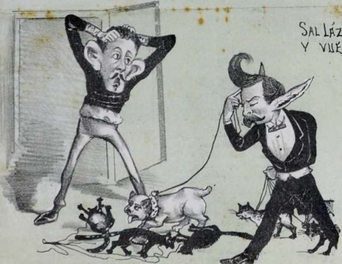
MUCHOS GATOS LLEVÓ TAJES. PERO MUCHOS MÁS, MENSAJES