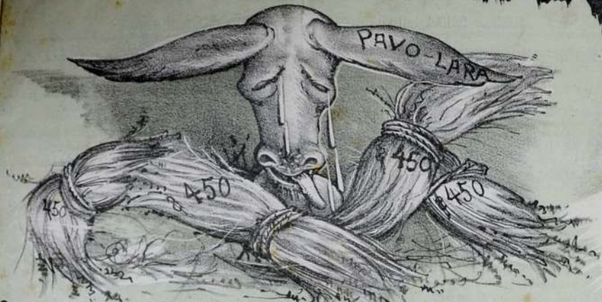
SOBRELLEVA TU DOLOR, Y NO PONGAS MALA CARA PUES QUE TE HALLAS PAVO-LARA EN TU GRAN PUESTO DE HONOR