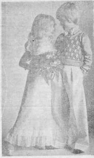
Los chicos crecen... ¡Y con qué prisa! Son cosas de la época... Los niños se sienten mayores y los mayores siguen siendo niños...

Hoy no hay reducho al que la mujer no haya llegado o esté en camino de