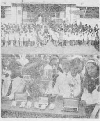
El frente de la Escuela Bellán con un grupo parcial de alumnos cantando el Himno Nacional, en sesión muy emotiva, luego de la llegada de los competidores. Es mesa en la cual pesan los trofeos que se disputaron.

no lo que falta del siglo, aunque el extendido el período hasta el año 2020, que podría ser absorbida hasta en un 85% por las actuales plantas urbanas de los distintos departamentos. Se mantendría, por lo tanto, la necesidad de cubrir la eventual falta de habitantes de los distintos departamentos. A efectos de lograr una armónica coordinación en el número futuro de habitantes del país, el ingeniero Reig propone un incremento de la actividad industrial de la República por el porcentaje restante. Montevideo, por su parte, podría llegar a los dos millones, lo cual lo pondría en el límite de su capacidad local. A efectos de lograr una armónica coordinación en el número futuro de habitantes del país, el ingeniero Reig propone un incremento de la actividad industrial de la República por el porcentaje restante. Montevideo, por su parte, podría llegar a los dos millones, lo cual lo pondría en el límite de su capacidad local. A efectos de lograr una armónica coordinación en el número futuro de habitantes del país, el ingeniero Reig propone un incremento de la actividad industrial de la República por el porcentaje restante. Montevideo, por su parte, podría llegar a los dos millones, lo cual lo pondría en el límite de su capacidad local.