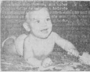
Fiestas, Casamientos, Cumpleaños, Despedidas, MURALES

ATENCIÓN: Avisando con 15 días de anticipación la fecha de su enlace, cumpleaños de 15, o el primer año de casamiento, le será publicada la foto de la fiesta en EL CLARIN, sin cargo alguno.