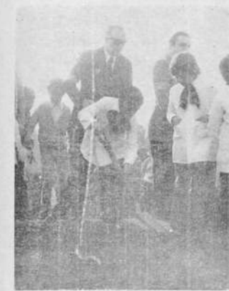
PLANTAN IBIRAPITA Y ARBOLILLOS EN PARQUE BELLAN