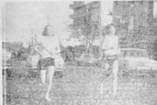
LA PRIMER MUJER URUGUAYA QUE TRIUNFA EN MARATHON CALLEJERA