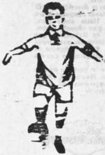
El domingo pda., en el field de Punta Carreta, se apuraron los combates por la final entre los tenistas de Dublín y Punta Carreta, Arcón

y Sportivo Punta Carreta, primera y segunda divisiones, respectivamente con el resultado conocido en el epígrafe.