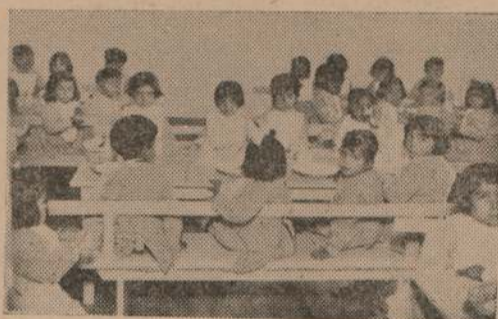
Estas elocuentísimas notas nos muestran, arriba, los niños reposando después del almuerzo y abajo, dos vistas: un grupo de niños almorzando y un salón cuyo decorado habla por sí solo de la inteligente orientación que impera en el "Comedor de la Libertad".

amplio comedor infantil al que se le ha puesto la significativa denominación de "Comedor de la Libertad".