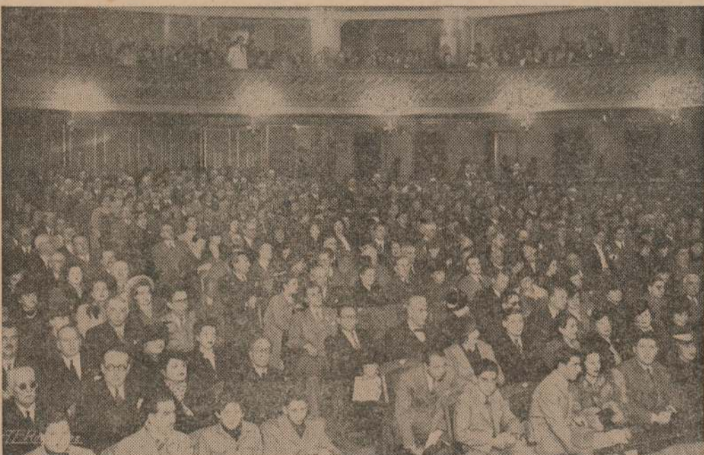
La composición gráfica que publicamos, muestra dos aspectos del homenaje a Estados Unidos, en los cuales aparecen el estrado, en momentos en que se ejecutaba el Himno Nacional y una vista del numeroso público que llenaba totalmente el Estudio Auditorio.