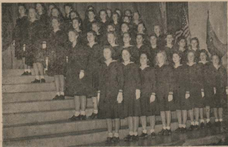
El bello conjunto de las alumnas del Instituto Crandon, que en'onaron magistralmente los himnos uruguayo y estadounidense.

Y dice la Declaratoria: «Enemigos en la guerra y amigos en la paz». Y para sostener la actual situación de guerra ha realizado este increíble esfuerzo esa nación, cual ninguna amiga de la paz, y cuyo espíritu pacifista encarnó, no ha mucho, su ilustre Presidente, cuando después de exponer la magnitud de